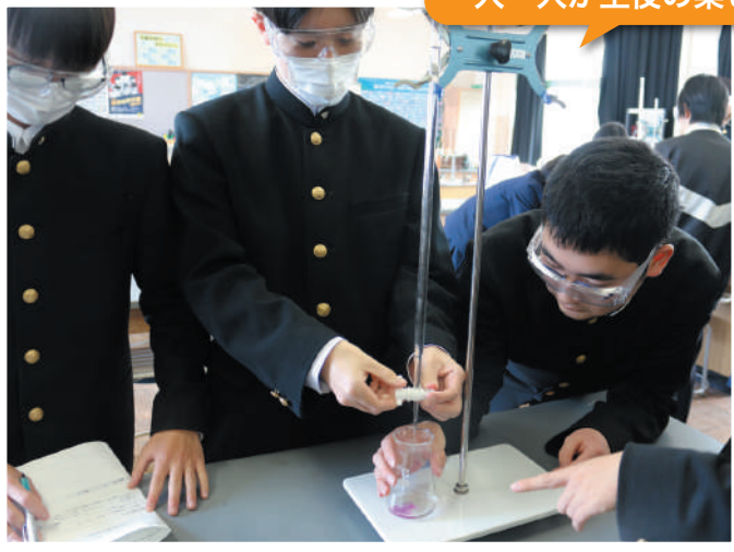
一人一人が主役の楽しい実験