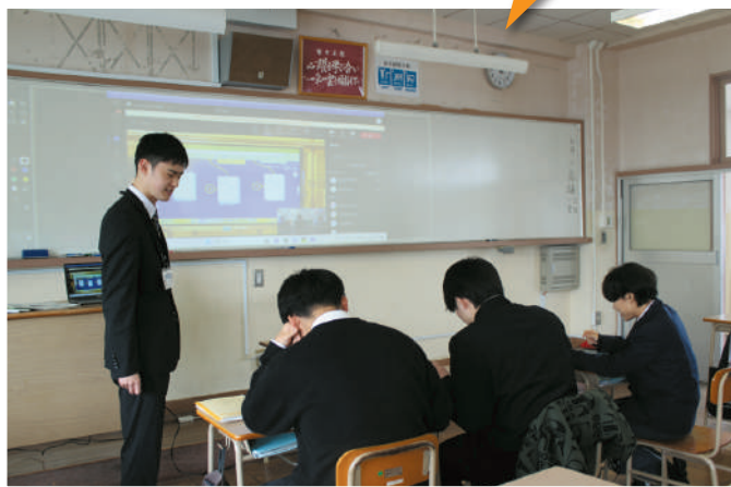
少人数を活かした多様な授業