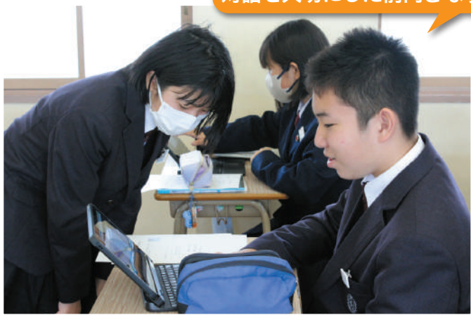
対話を大切にした前向きな学び